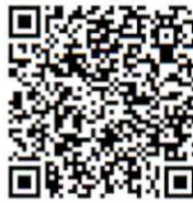
QR CODE รับสมัคร