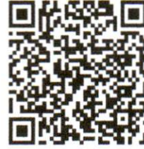
รุ่นที่ ๒ (๑๒ ก.ค. ๖๕)