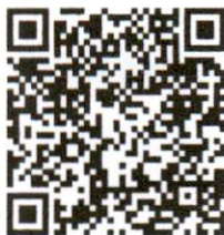
รุ่นที่ ๓ (๒๕ ก.ค. ๖๕)